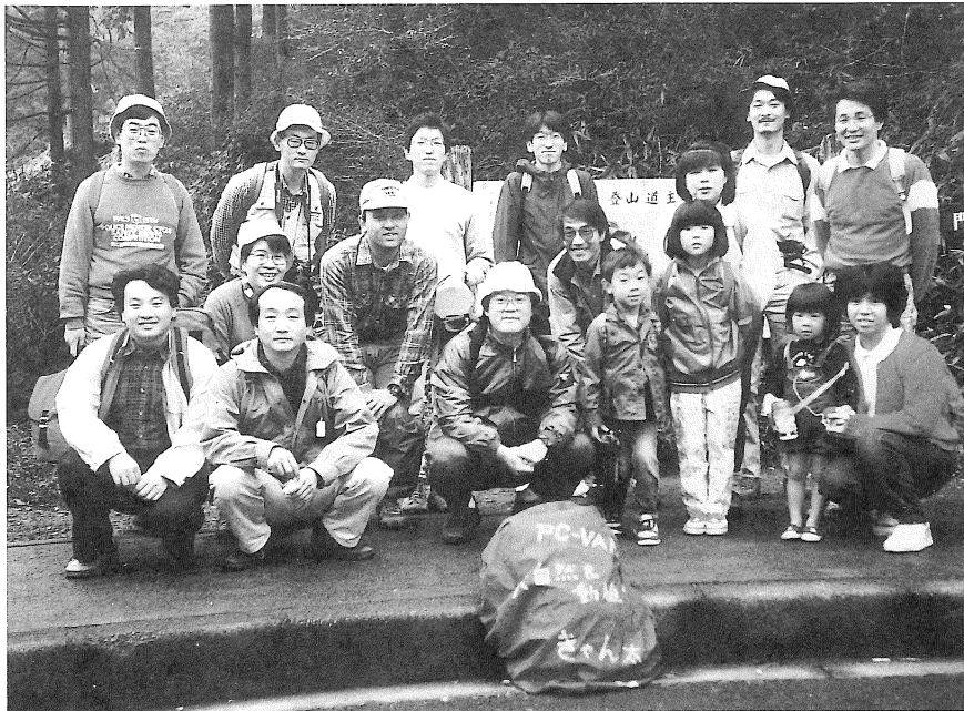
'89年10月22日「紅葉のハイキング&バーベキューパーティ」で。(前列左端)

ど、激変の生活環境でしたが、メンバーの暖かい励ましのおかげで、無事現在に至っています。